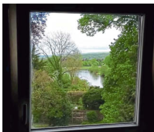
Platz 3: Belegt von Janis Huyghe.