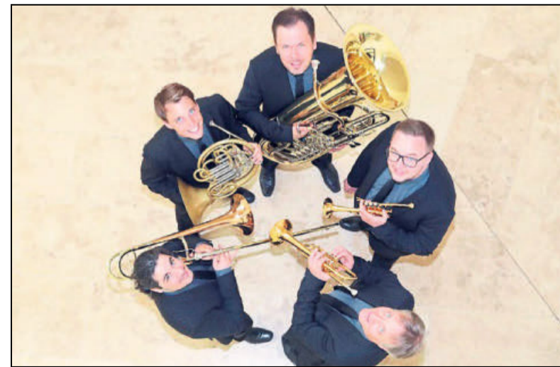
»Classic Brass« setzt Maßstäbe in der Blechbläser-Kammermusik.

Mit ihrem unverwechselbaren Sound erreichen die adretten Klangvirtuosen jede Altersgruppe und jeden Geschmack. Nicht nur geistliche Musik, auch Unterhaltungsmusik der letzten Jahrhunderte sind im Programm des Ensembles enthalten. Besonders hervorzuheben sind die vielen