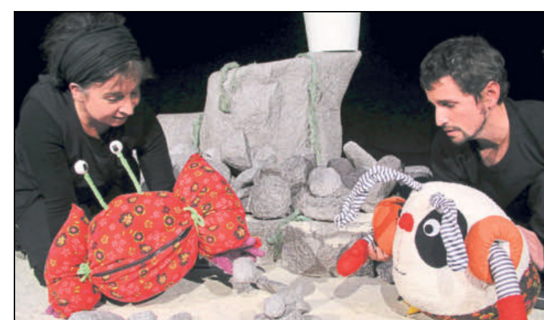
Das »Theater zwischen den Dörfern« bringt am Mittwoch, 23. Januar, das Stück »Das Meerdings« auf die Bühne.