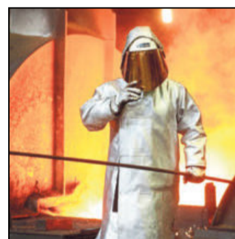
Ein Stahlarbeiter am Hochofen.

genommen zu bleiben, aber falls nötig sind wir bereit«, sagte eine Sprecherin der Brüsseler Behörde. Für den Fall, dass europäische Unternehmen nicht dauerhaft von den neuen