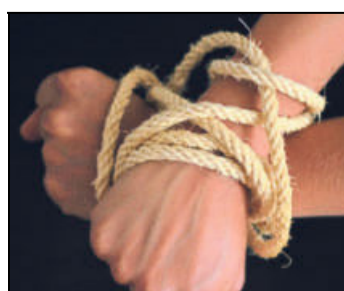
Die Polizei staunt über die Fesselungen.

Neustadt (dpa). Nach einem Polizeieinsatz in der Pfalz haben die Beamten eine Einladung zu einem erotischen Fesselkurs à la »Fifty Shades of Grey« bekommen. Zuvor hatte ein Mann den Hinweis gegeben, dass in einer Wohnung in Neustadt an der Weinstraße eine gefesselte nackte Frau von zwei Männern misshandelt werde. Dies habe er vom Treppenhausefenster beobachtet. Am ver-