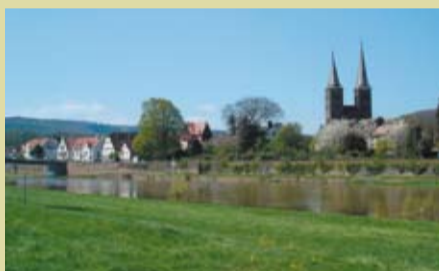
Blick vom Wohnmobilhafen am Floßplatz auf das gegenüberliegende Höxter

Höxter besitzt zwei herrliche Wohnmobilstellplätze. In Stadtnähe befindet sich der Wohnmobilhafen „Höxter am Floßplatz“. Von diesem Stellplatz direkt an der Weser genießen Sie den Blick auf die Kulisse der Altstadt. Der Stellplatz ist mit einer Holiday Clean Ver- und Entsorgungsstation ausgestattet.